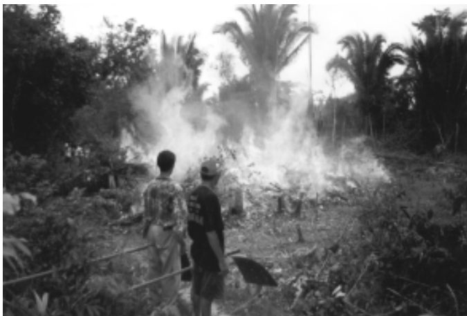
Incendio forestal en la comunidad de Marabá, Estado de Pará.

■ “Puxirum ambiental”, trabajo comunitario voluntario en favor del medio ambiente: En algunas comunidades, combinando la capacitación sólida y eficaz de los líderes e instructores y el apoyo de la comunidad, se crea lo que se conoce localmente como “Puxirum ambiental”. Puxirum es una práctica comunitaria de labores voluntarias en brigadas de trabajo dedicadas a terrenos comunes o a la propiedad individual de algún miembro de la comunidad. Esto se suele hacer para las siembras, la construcción u otras actividades que requieran una cantidad significativa de mano de obra. El concepto del puxirum ambiental se incorpora al proyecto con la participación de brigadas comunitarias dedicadas a resolver o prevenir problemas relacionados con el medio ambiente. Estas brigadas se movilizan y capacitan en técnicas de prevención de incendios, extinción de fuegos forestales y divulgación de estas técnicas, y reciben instrucción sobre el medio ambiente así como sobre la forma de abordar otros asuntos ecológicos (por ejemplo, el de la reforestación). Esta iniciativa ha