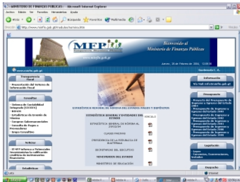
Gráfico 2. Acceso al Portal de Transparencia de Guatemala a través del sitio web del Ministerio de Finanzas Públicas.

En términos generales, el portal carece de la información detallada sobre el marco de referencia dentro del cual se ejecutó el presupuesto. Tampoco presenta información sobre las leyes presupuestarias ni los datos macroeconómicos del año correspondiente. Al igual que otros portales, esto dificulta las comparaciones entre gastos planeados y reales.