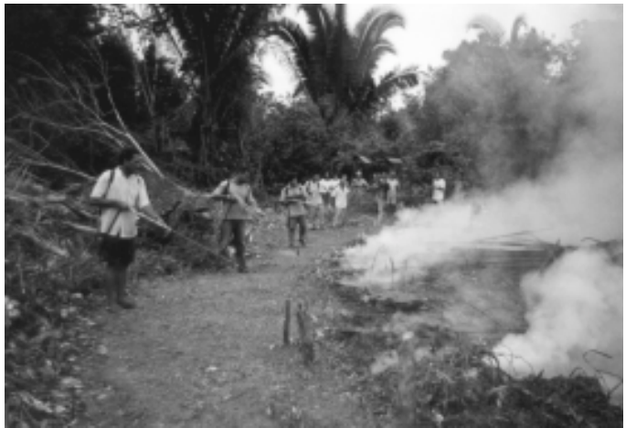
Puxirum en Marabá, Estado de Pará – Curso de capacitación ofrecido a la población local sobre control/prevención de incendios forestales.

para los cultivos. Esta capacitación es impartida en forma conjunta por el GTA, el IBAMA y los bomberos. Como se mencionaba antes, posteriormente cada uno de los participantes lleva cabo a tres sesiones de capacitación al nivel municipal con los líderes comunitarios, en seminarios de aproximadamente 30 personas cada uno. En esta forma se va creando un efecto dominó, a medida que cada uno de estos líderes comunitarios divulga los conocimientos recién adquiridos a sus respectivas comunidades.